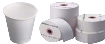
紙コップ・レジロール