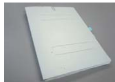
紙ファイル・フラットファイル