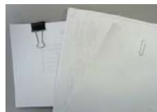
クリップ・ホチキス