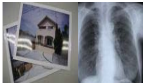
写真・レントゲン写真